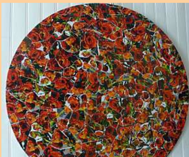
Stéphane Denépoux Bouquet de roses